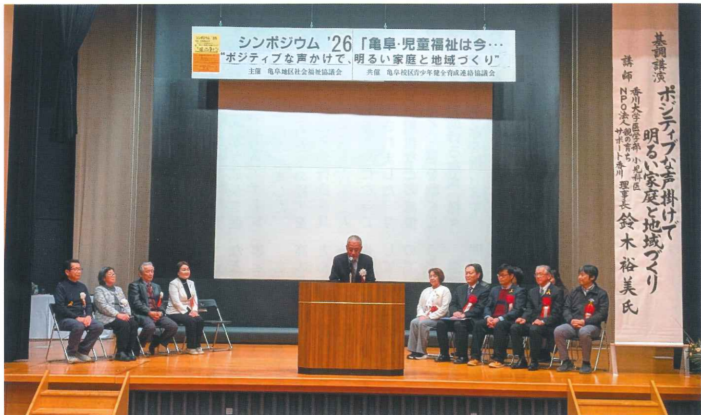
シンポジウム '26 開催