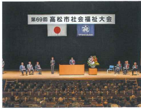
第69回 高松市社会福祉大会